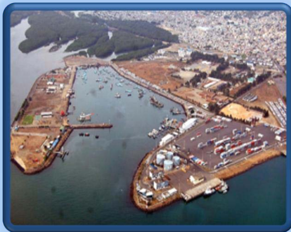
CIUDAD DE ESMERALDAS

El puerto de Balao, es el puerto petrolero del Ecuador. La playa de Esmeraldas es hermosa que ofrece fines de semana con atención culinaria, vida nocturna y bastante diversión.