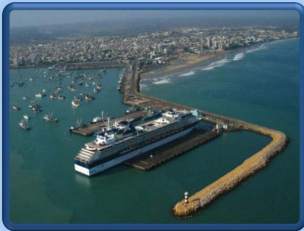
CIUDAD DE MANTA

En la actualidad, existen más de 300 barcos pesqueros industriales, así como 3000 fibras artesanales que unidos a decenas de barcos camaroneros forman la mayor flota pesquera del Ecuador.