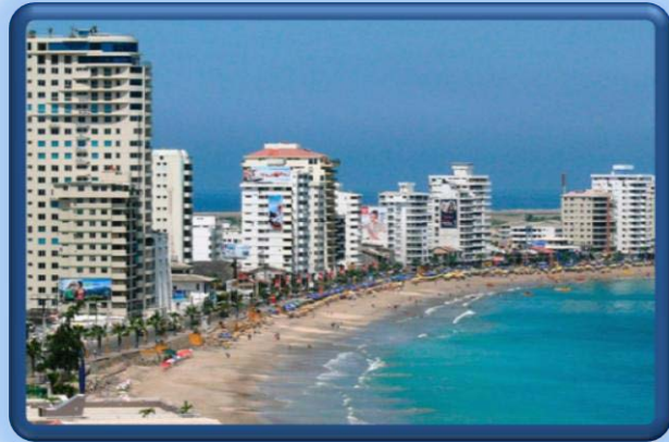
CIUDAD DE SALINAS

Ubicado en la parte más occidental del Ecuador continental, es el balneario más importante de la provincia de Santa Elena y del Ecuador, por la bondad de su clima y sus grandes playas de arenas blancas. Cuenta con hoteles desde cinco estrellas hasta los más económicos, además dispone de y lugares de ocio nocturno. Anualmente se realizan campeonatos de surf, tenis y también se dan conciertos.