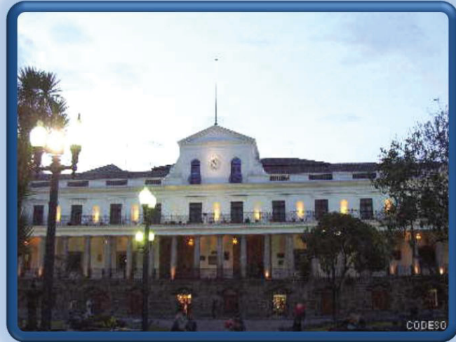
CIUDAD DE QUITO

Es famosa por sus templos coloniales construidos en los siglos XVI y XVII; se destacan San Francisco, La Compañía, La Merced, La Catedral, Santo Domingo, San Agustín y otros. Fue designada por la UNESCO “Patrimonio Cultural de la Humanidad” por la riqueza de sus obras artísticas.