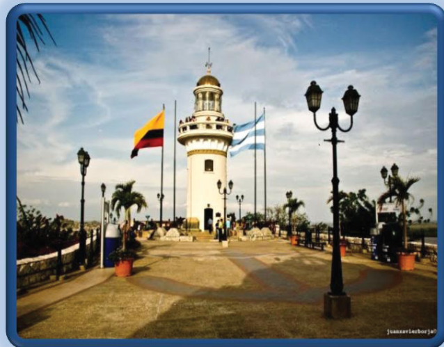
CIUDAD DE GUAYAQUIL

Concentra las actividades de exportación e importación y dispone de modernas instalaciones portuarias, consideradas como una de las mejores de la costa oeste sudamericana; su altura es a 4 m. sobre el nivel mar.